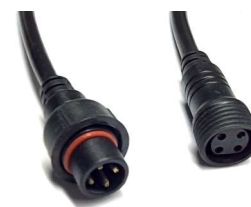
Złącze wyświetlacza GLS-M17